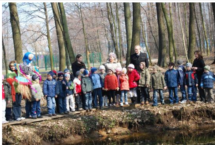
Topienie Marzanny w malanowskim parku

Dnia 23.03.2010 r. dzieci z Gminnego Przedszkola w Malanowie wraz z wychowawcami i paniami ze Stowarzyszenia Emerytów w Malanowie pożegnały zimę, a następnie powitały najpiękniejszą porę roku, na którą wszyscy czekaliśmy z wielką niecierpliwością, a mianowicie wiosnę. Barwny korowód przedszkolaków śpiewających wiosenne piosenki udał się do parku, aby tam pożegnać zimę, wrzucając słomianą kukłę do wody. Na miejscu czekała już niespodzianka - czekoladowe zajaczkę i jajeczka, które dzieci miały za zadanie znaleźć wśród drzew parku. Sprawilo to dzieciom wiele radości. Po udanych poszukiwaniach dzieci z rumieńcami na twarzy wróciły do przedszkola, mając nadzieję, że już na dobre pożegnały zimę. Zadowolone były również panie ze Stowarzyszenia Emerytów z Malanowa, które przygotowały dla dzieci przedpołudnie pełne wrażeń. Przedszkolaki w zamian za zorganizowanie dla nich tak wspaniałego