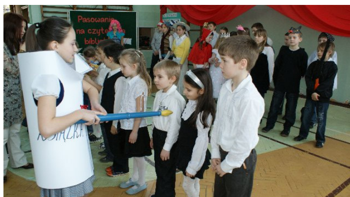
Uroczyste pasowanie na czytelnika biblioteki

Uczniowie klas Ia i Ib z powagą obejrzeni inscenizację, po której złożyli uroczyste przyrzeczenie. W ten sposób zobowiązali się do częstego odwiedzania biblioteki, korzystania z księgozbioru i szanowania książek.