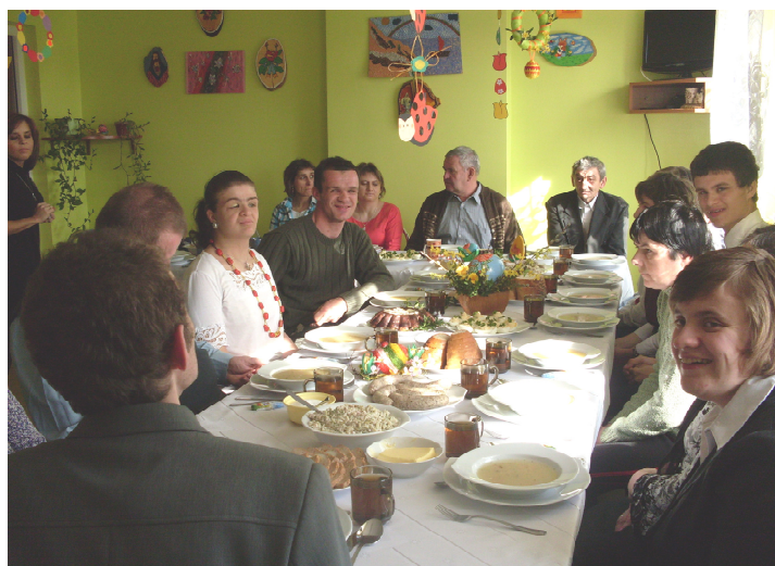
Przy wspólnym śniadaniu