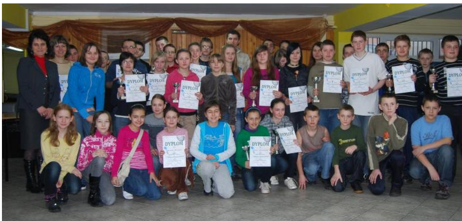
Zwycięcy w poszczególnych kategoriach wiekowych

Na szczególne wyróżnienie zasłużyli reprezentanci Szkoły Podstawowej w Miłaczewie, którzy zdominowali rozgrywki w swoich kategoriach, zajmując wszystkie miejsca na podium, zarówno wśród dziewcząt, jak i chłopców. Tak dużego sukcesu uczniów z Miłaczewa nie byłoby