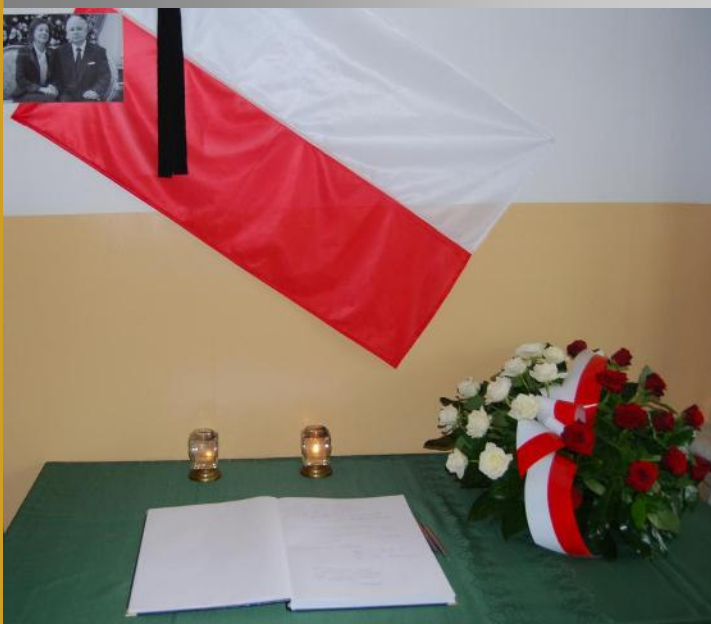
Księga kondolencyjna w Urzędzie Gminy w Malanowie

D nia 10 kwietnia 2010 r. podczas lotu na uroczystości upamiętniające 70. rocznicę dokonania zbrodni katyńskiej, doszło do tragicznej w skutkach katastrofy lotniczej.