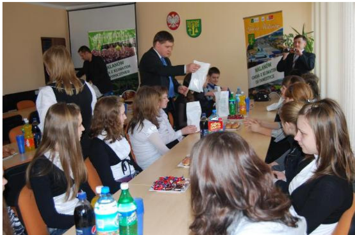
Wójt gminy przekazuje upominki uczniom SP nr 1 w Tulczynie

Po raz kolejny przebywała z wizytą w Malanowie delegacja młodzieży wraz z opiekunami z Ukrainy. Przybyli goście podczas pobytu poznali historię gminy Malanów oraz odwiedzili ciekawe miejsca.