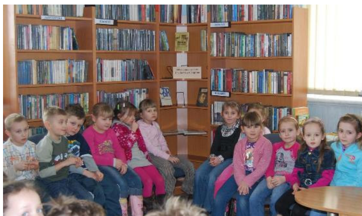
Przedшкоlaki podczas lekcji bibliotecznej

18 marca dzieci z grupy II, III i IV wyjechały na wycieczkę do Turku. W Miejskim Domu Kultury obejrzały przedstawienie pt. "Mały Chopin" w wykonaniu aktorów Teatru Konsekwentnego z Warszawy. Zabawne teksty pomogły maluchom przybliżyć życie małego Fryderyka i początki jego twórczości oraz utwory, które two-