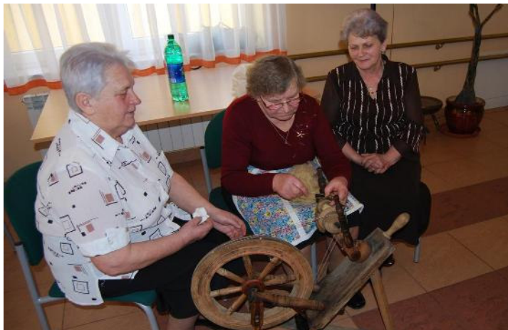
Pokaz przędzenia na kołowrotku

cd. ze str. 1 Zespół „Tradycja” w ludowych strojach przy akompaniamencie skrzypiec i akordeonu zaprezentował dawne pieśni, które obecnie są zapomniane i których wielu młodych ludzi nie miało okazji nigdy usłyszeć. Następnie przedszkolaki z Gminnego Przedszkola w Malanowie oraz dzieci ze Szkoły Podstawowej